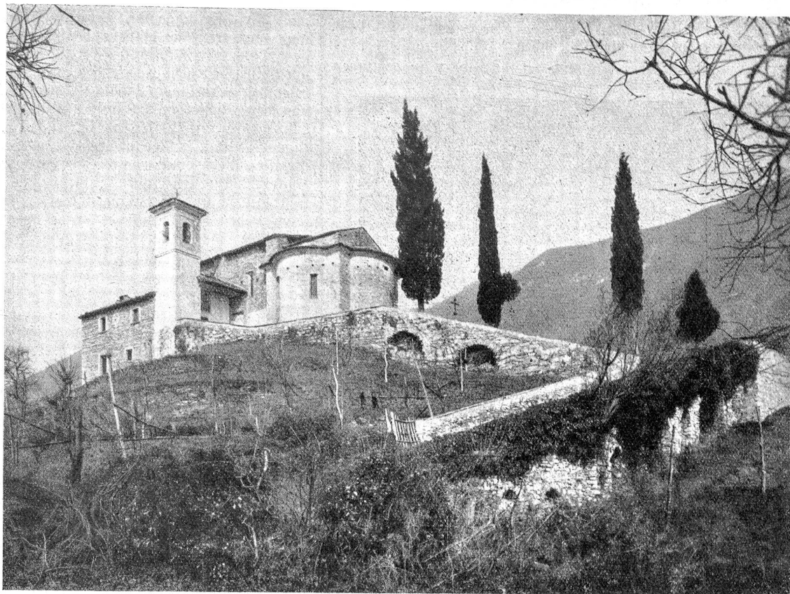
Kirchlein oberhalb Castelsanpietro (Mendrisio). (Zum Aufsatz „Haus und Landschaft im Kanton Tessin“.)