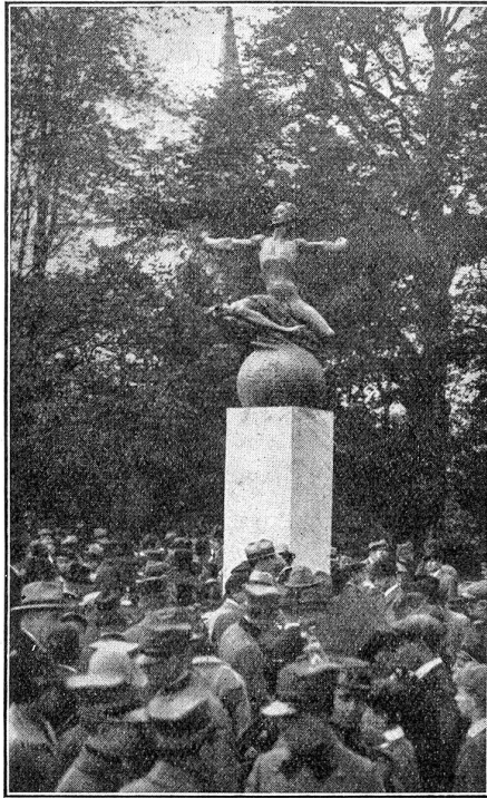
Das Bider-Denkmal auf der Kleinen Schanze in Bern.

Am letzten Samstag ist in der Bundesstadt das Bider-Denkmal feierlich ein-