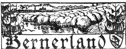
† Dr. Eduard von Werdt.

Nach einer Frist von 14 Jahren seit dem eidgenössischen Unteroffiziersfest in St. Gallen finden 1925 in Zug die 23. Schweizerischen Unteroffizierstage statt. Sie stützen sich auf ein neues Reglement, das auf die Prinzipien und Erfahrungen des modernen Kampfverfahrens und der fortgeschrittenen Spezialisierung der Waffengattungen aufgebaut ist. Angesichts der einzigartigen Bedeutung der Unteroffizierstage für die geistige und körperliche Ertüchtigung des Schweizerischen Unteroffizierskorps haben verschiedene Regierungen wie Aargau, Appenzell A.-Rh., Waadt, namhafte Subventionen zugesprochen. —