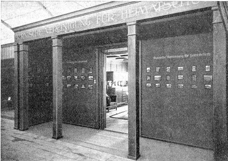
Ausstellung von Photographien alter Bauten (Speicher und Landsitze) mit Eingang in die Bauern-Visitenstube an der Kantonalen Gewerbeausstellung in Burdorf.

Bern, dem Verfasser des Speicherbuches*), als neue Anregung für künftige ländliche Kultur eine Bauernstube mit vollständiger Ausstattung. Ihr Schöpfer in allen Einzelheiten ist Herr Architekt Ernst Häberli in Bern (Häberli & Eng), der die Entwürfe im Auftrage des Vorstandes, dem er selbst angehört, angefertigt hat.