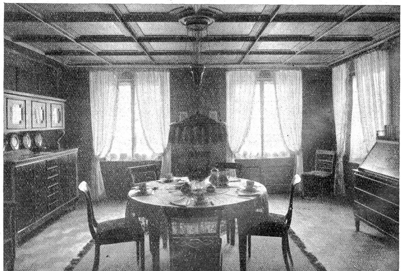
Blick gegen die Fenster.

So muß gerade die Stadt ihre Sünde wieder gutzumachen suchen. Die bernische Vereinigung für Heimatschutz möchte mit ihrer Visitenstube einen Vorschlag machen, wie man im Bauernhause einen freundlichen Raum schaffen kann, in den sich die Meisterleute auch in ihren Alltagskleidern hineinwagen. So würde der nur bei großen gesellschaftlichen Ansprüchen nötige und im einfachen bürgerlichen oder bäuerlichen Heim gänzlich überflüssige „Salon“