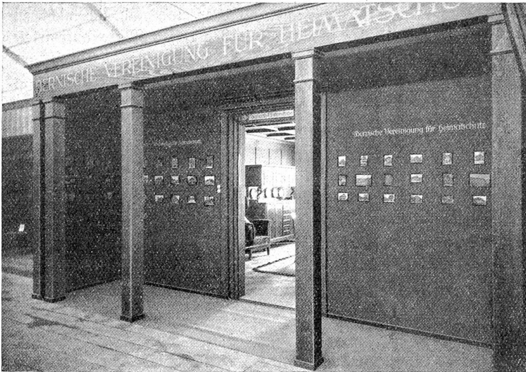
Ausstellung von Photographien alter Bauten (Speicher und Landsitze) mit Eingang in die Bauern-Visitenstube an der Kantonalen Gewerbeausstellung in Burgdorf.