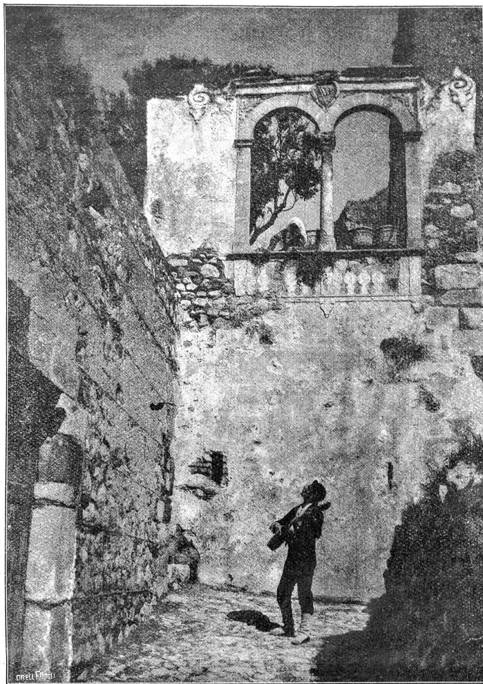
Sizilianisches Ständchen.

Kaum vermochte man vor der Enge der Gäßlein durchzukommen. Endlich gelangten wir zum Dom, der ziemlich auf dem höchsten Punkt der Stadt liegt und mit seinem Kirchturm die Häuser weit überragt. Das Innere des Domes war eben in Restauration begriffen, indem die alten Pfeiler und Bogen in ihrer ursprünglichen Gestalt wieder freigelegt werden.