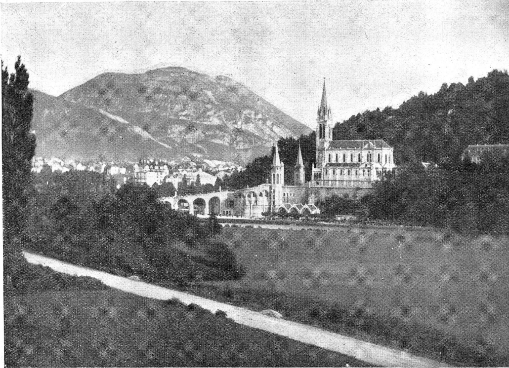
Die Wallfahrtskirche in Lourdes (Südfrankreich),

zu welcher alljährlich bis 500,000 Pilger aus aller Herren Länder wallfahrten. Besonders groß ist der Andrang der Wundergläubigen anlässlich der Osterprozession. — In der Nähe des Pyrenäenstädtchens Lourdes (ca. 8000 Einw.) befindet sich die berühmte Grotte, in der 1858 die Jungfrau Maria der 14-jährigen Bernadette Soubirous (gest. 1870) erschienen sein soll. Seit 1862 ist das Wunder von der katholischen Kirche anerkannt und bildet die Grotte eine Stätte gläubiger Verehrung. In der Grotte befindet sich eine wundertätige Quelle, deren Wasser auch in Flaschen weithin verschickt wird. Die Kirche Notre Dame, die unsere Abbildung zeigt, wurde von 1864–70 im byzantinischen Stil ausgeführt; gleichzeitig entstanden viele Kapellen, Klöster, Hotels, Verkaufsläden etc., ein neuer Stadtteil. Von Zeit zu Zeit liest man von neuen Wunderheilungen, die den guten Ruf des Wallfahrtsortes wieder neu auffrischen und verbreiten.