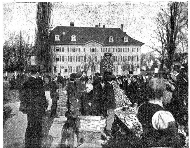
Der Zielemärkt auf dem Waisenhausplatz in Bern.

D'Geisle fat a chlepfe; „Hü Schümu, zieh brav!“ Adio! Adio! u mit Lärme verschwindet das Gfähr über das holperige Pflaschter d'Brunggah ab. Alles luegt ne mache, däm glückliche Paar, die ihres Zämecho u ihres Glück einzig und allei d'm hütige Tag, d'm Chachelmarit z'verdanke hei.