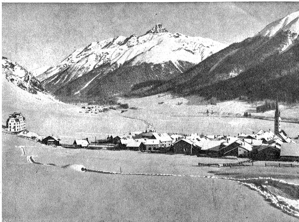
Zuoz: Dorfansicht von Westen. (S. 2. Aufj. Seite 532.)

Wenn sie aufstanden, nahm er Marias Hand und sie gingen so bis zur Stadt. Wenn er ihre Hand dann aber fallen ließ, so wußte er wieder nicht, ob sie nun froh war, oder ob sie vorher froh gewesen wäre, da er ihre Hand noch in der seinen gehalten hatte.