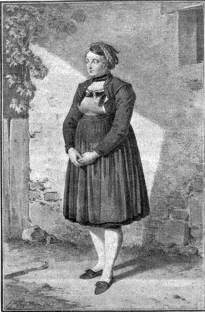
S. Freudenberger. — Guggisbergerin.

(Klischee aus dem Katalog der Ausstellung Freudenberger-König im Kunstmuseum.)