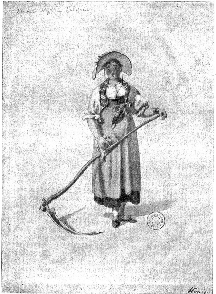
S. R. König. — Die Mäherin.

Freudenberger kam 1773 nach Bern zurück; wir wissen, daß es nicht seine Absicht war, sich dauernd in der Heimat niederzulassen; er wollte nur seine Freunde und Verwandten besuchen und dann wieder nach Paris zurückkehren. In Bern aber fand er so günstige Verhältnisse vor, daß er sich leicht entschließen konnte, in dieser Stadt Wohnsitz zu nehmen. Das damalige patrizische Bern war ganz französisch orientiert. Was irgend zur besseren Gesellschaft gehörte, sprach französisch. Die jungen Patriziersöhne strebten, kaum flügge geworden, nach Paris, um dort, im Dienste eines Schweizerregiments, den weltmännischen Schliff, das „ savoir vivre “, zu gewinnen. Mit Anschauungen, die ganz durchdränkt waren von den Eindrücken aus Paris und Versailles, kehrten sie nach Hause zurück. Hier ahmten sie das Leben der Pariser „ petits maitres “ nach, so gut oder so schlecht dies ihnen die heimatlischen Verhältnisse erlaubten. Sie kleideten sich nach Pariser Schnitt — von den jungen Damen nicht zu reden, die schon damals wußten, was in der französischen Hauptstadt Mode war. Sie liebten sich Landsitze bauen nach dem Stil der französischen Campagnen mit Rokotomotiven außen und innen. Französische Architekten gaben zur Zeit des finanzmächtigen Hieronymus von Erlach und auch späterhin in Bern den Ton an. Die fran-