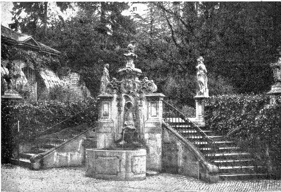
Zürich. Im Garten des Hauses „zum Reiberg“. Um 1770. (Druckstock aus „Die alte Schweiz“.)