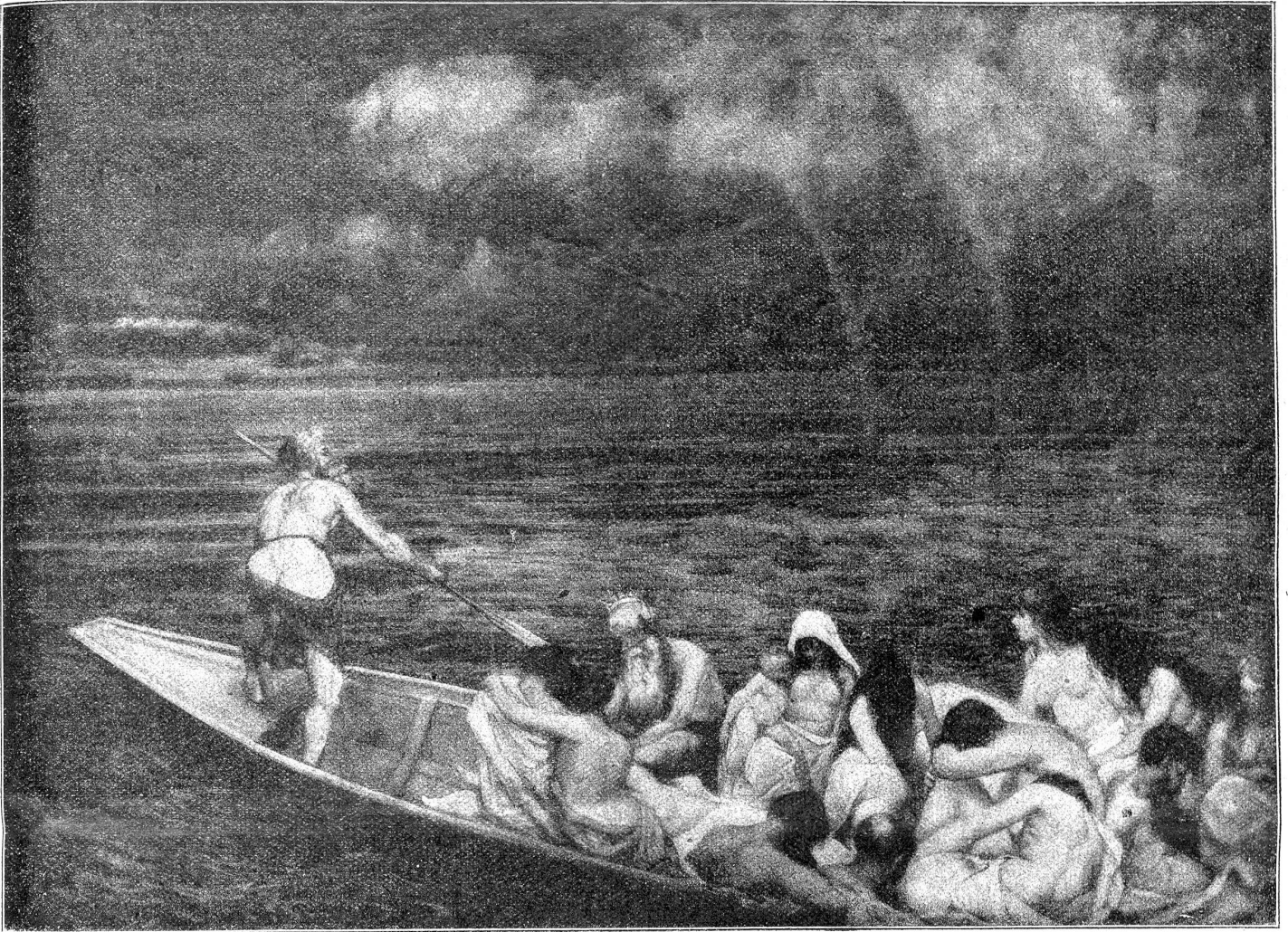
Charon. — Nach einem Gemälde von Hans Thoma.

Charon in der griechischen Mythologie der greise, stumme Fährmann, der die Schatten der beerdigten Toten über die Flüsse der Unterwelt fährte, wofür er einen dem Toten in den Mund gesteckten Obolos (Münze) erhielt. Ein beliebtes Motiv für Künstler. Thoma hat das Grauen und die Verzagtheit der Seelen auf der traurigen Fahrt über die dunklen Wasser der Unterwelt ergreifend dargestellt.