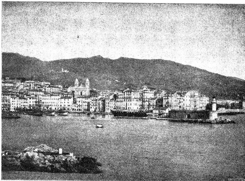
Bastia, Hafenstadt an der Nordküste Korsikas.

Von der Paghöhe zogen wir nordwärts zum Grat des capcorsischen Bergzuges hin und stiegen zum etwa 1000 Meter hohen Pigno hinauf. Der wenig unterhaltene Fußpfad führte durch niedriges Gesträuch, bestehend aus wohlriechenden Erikabäumen, Myrten, Ginster, Thymian. Wacholder, Erdbeerbäumen (arbusier) und dergl. Es ist bekannt unter dem Namen Macchia, franz. maquis, „immergrüner Buschwald“ (nach Riffi) und bedeckt mehr als die Hälfte des korsischen Bodens, was der Insel vor allem das seltsame Aussehen gibt. Unendlich viel Mühe braucht es, die nur Bienenhonig, Wurzelholz und magere Ziegenweide bietende Macchia auszureuten und an ihre Stelle auf dem karglichen Erdreich Felser und Fruchtgärten anzulegen. Seit ältesten Zeiten scheint der Korse an dieser Beschäftigung keine besondere Freude gehabt zu haben, und daß er sie etwa jetzt bekomme, ist wenig wahrscheinlich; wäre doch der hieraus resultierende Lohn namentlich heutzutage gar zu karg, während die durch den Militärdienst sowieso geförderte Auswanderung nach dem französischen Festland und besonders nach den Kolonien Algier und Tu-