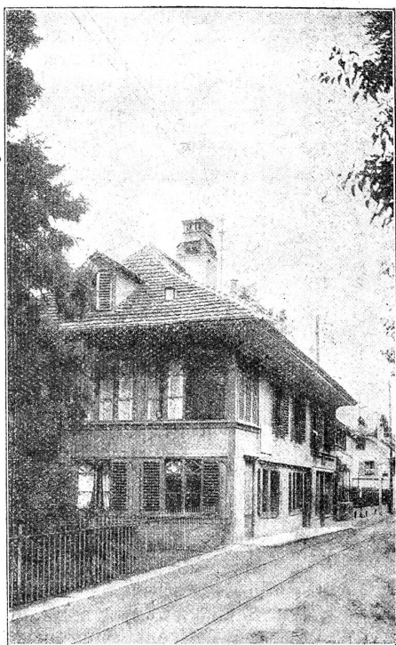
Johannes Brahms Wohnhaus in Thun.

Orchestervereins Thun und des Berner Stadtorchesters mehrere Werke des Meisters zur Aufführung bringen. Wir möchten nicht verfehlen, unsere Leser auf den genussverspre-