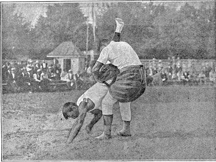
Eidg. Schwing- und Aelplerfest Bern. Honegger, Rütli — Kunz, Meinsberg.

plauderer, auf den wir gerne in Wort und Bild zurückkommen werden. —