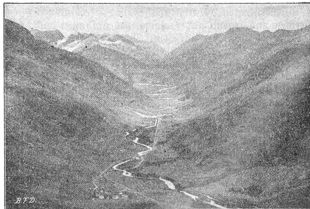
Das Urserental von der Furka aus gesehen.