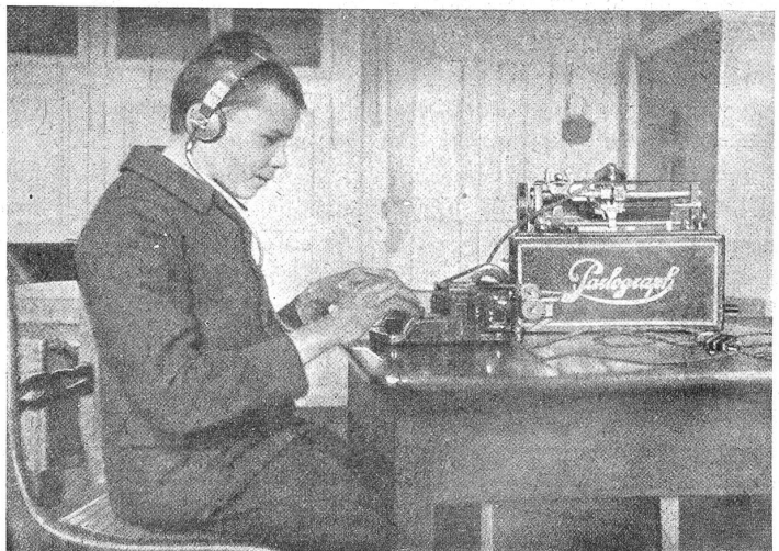
Am Parlograph: Uebertragung des Diktats in Blindenschrift.

auf Dorf und Stadt und weite, duftige Ferne ist hier ein Stückchen Erde, wie es schöner in großem Umkreise schwerlich zu treffen ist. Nun wird ja freilich, ob der schimmerndste Tag über der blauen Flut schwebt, in die dunkle Nacht des Blinden kein verheißender Schein dringen. Doch in den hellen, der Sonne weit offenen Räumen werden auch unsere Blinden sich heimisch fühlen. Der Gesundbrunnen fließt auch ihnen. Die vielen Wege und Ruheplätzchen des schönen Parks und des Waldes locken sie, wie die Sehenden, in den Mußestunden ins Freie, zu beschaulichem Ausruhen und zu unternehmendem Spiel. Die anregende Bergluft weckt in ihnen die Freude eines Aufenthalts in der Höhe. Der Duft besonnener Wiesen, vermischt mit würzigem Harzgeruch, das Rufen und Singen der Vögel, das Flüstern der Wipfel und das rauschende Lied des Baches versehen sie mitten hinein ins geheimnisvolle Leben und Wehen der Natur. Unten ladet der See zum Bade. Die leicht fallende Straße, der sanft geneigte Hang werden den Schlitten- und Skisport aufleben lassen, und an Zielen für abwechslungsreiche Sonntagsausflüge wird kaum ein Ende zu finden sein. Unsere nur schwachsichtigen Schutzbefohlenen werden auch den Glanz der Aussicht entdecken können. Die zum Dienst an den Blinden hier oben leben, werden vollends den Anblick der leuchten Welt so dankbar empfinden, wie Menschenherzen es nur verstehen. Und Einheimischen und Fremden wird auch inskünftig der Zutritt nach Möglichkeit offen bleiben.