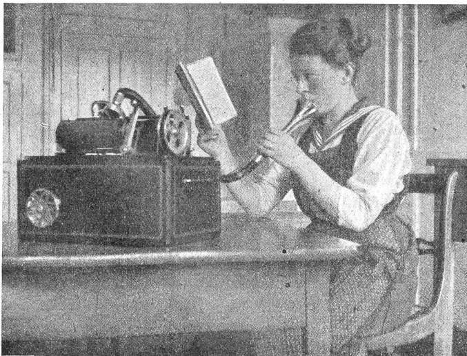
Am Parlograph: Diktat.

Ich habe mir nunmehr fest vorgenommen, alle Jahre hierher zu kommen. Es ist halt alles viel zu schön, um es in einem Male auskosten zu können. — Immer wieder wünschte ich in diesen Tagen, doch einige meiner Freunde bei mir zu haben, damit wir uns in all das Schöne und Gute hätten teilen können. Diesen Wunsch habe ich überhaupt immer, wenn ich allein bin, um etwas Großes und Unvergessliches zu genießen. — Ich habe nun auch die Zimmer — man kann schon fast sagen Gemächer —