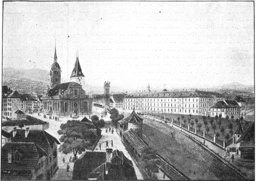
Burgerspital in Bern. Aufnahme um das Jahr 1835 herum. 1. Spinnstube. 2. Lombachturm. 3. Christoffelturm. 4. Hirschengraben.

Ueber die Lage der Gefangenenbefreiungen bestehen ebenfalls Aufzeichnungen. Der französische General Schauenburg hatte dem Rat von Bern die Erklärung zugehen lassen, er hätte befohlen, daß sämtliche Strafgefangene beiderlei Geschlechtes, die wegen keiner andern Ursache als der Zuneigung zu Frankreich enthalten wären, die Freiheit zu schenken sei; wenn die Behörden nicht sofort einwilligen würden, hätten sie die selbe Gefangenschaft zu gewärtigen, welche jene Freunde der Freiheit verbüßen müßten. Was aus den Staatsgefangenen, die außer den Spinnstubengästen in Freiheit gesetzt wurden, geworden ist, weiß man nicht genau. Aber es besteht im bernischen Staatsarchiv noch eine Aufzeichnung, die besagt, daß sie sich in den gleichsam über Nacht anders gewordenen Verhältnissen nicht zurecht finden konnten, sondern treu zur alten Ordnung standen. Schauenburg hatte ihnen die Wahl gelassen, zu den Franzosen überzugehen, nach Hause zu gehen oder mit dem Vaterland zu kämpfen. Sie wählten das letztere. Viele von ihnen in den Kämpfen von Frau-