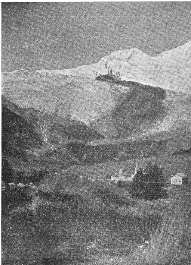
Saas-See mit Seegletscher und Alphubel.

ja, 's ist eigentlich wahr, ich bin ein unverschämter Patron. Wie kann ich denn verlangen, daß du, die mir schon so unendlich viel getan hat, hier deine Jugend vertrauern sollst. Du kannst doch sowieso nicht allweil hier bleiben.“