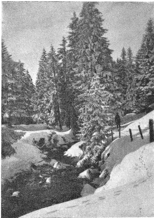
Ganterischgebiet (Bernner Voralpen). Waldweg beim Schwefelbergbad.

wurde der Einzug Jesu durch die Palmsonntagsprozession dargestellt. Bei diesen Prozessionen spielte der „Palmesel“