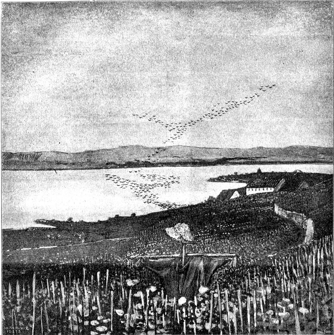
Starenflug. Nach dem Gemälde von Fritz Widmann, Rüschlikon.