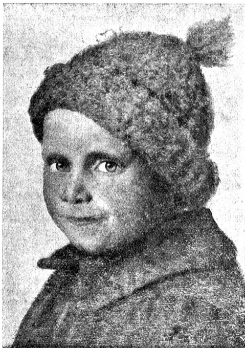
Rudolf Tschan: Knabenbildnis.

(Im Besitze von Wwe. C. Zimmstein, Bern.)