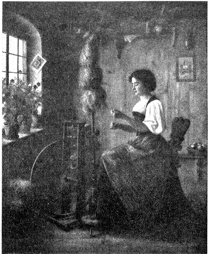
Rudolf Tschan: Die Spinnerin.

(Im Besitze von Wwe. C. Zimmstein, Bern.)