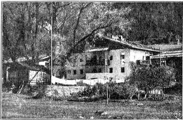
Das Sandwirts Haus Andreas Hofers Geburtshaus.

Mit solch unheilbarem Tirolerheimweh im Herzen sah ich einmal weit fort von daheim auf der sonnigen Veranda eines Strandhotels. Es war in Sydney in Australien. Ich sah über das Meer hinaus und dachte an die Heimat.