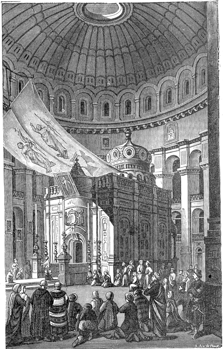
Das Innere der Grabeskirche mit der Grabkapelle, die die genaue Stelle des Grabes Christi bezeichnen soll.

Dann stürzt man sich wieder vorwärts mit steigender Hast dem Untergang entgegen.