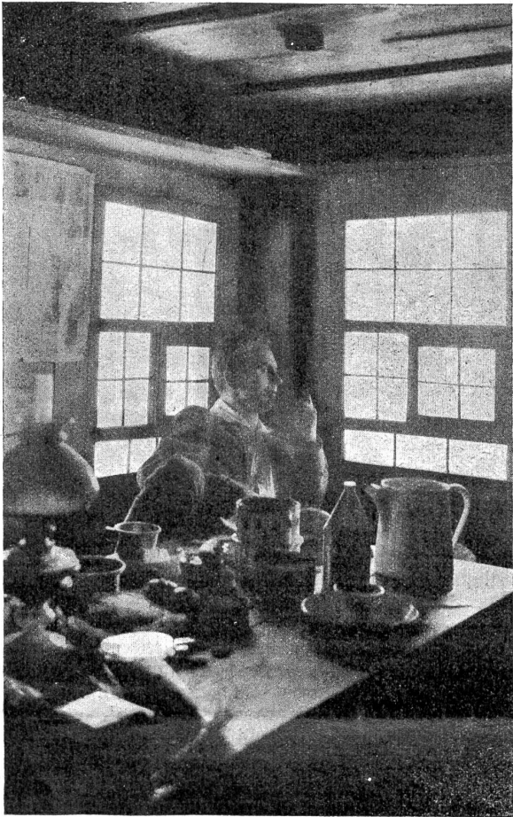
Inneres der Susterne-Hütte.

dramatischen mit flatterndem Germanenhaar auf den Ladli den Waldweg hinablaufen sehen, wobei zu bemerken ist, daß die in klassischem Faltenwurf umgeschlungenen Bettdecken und