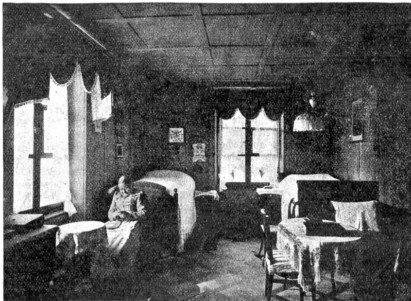
Dienstbotenheim Oeschberg bei Koppigen. Schlafzimmer für weibliche Heiminsassen.