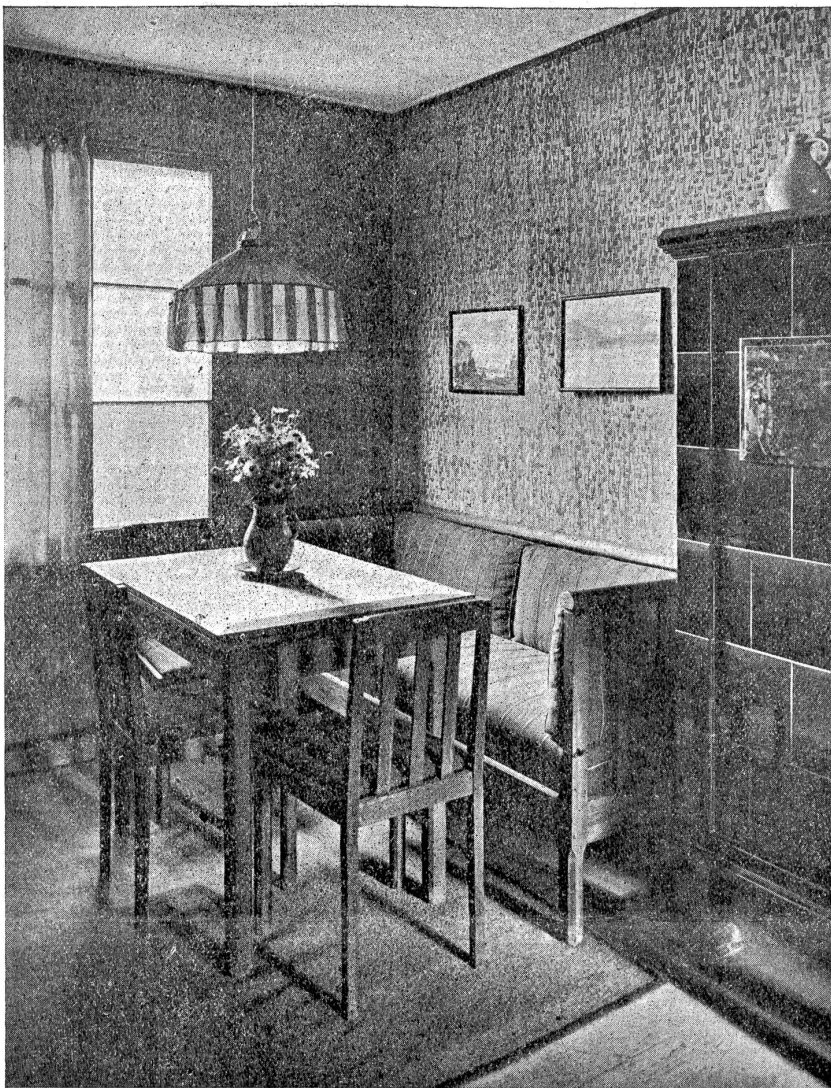
Werkbund-Ausstellung: Wohnzimmer aus der Arbeiterwohnung der Gewerbeschule Zürich. Cannen gebeizt. Kissen roh aus Gadmantalerstoffen.

nahme, und so ist diese geschlossene, einheitliche Ausstellung entstanden.