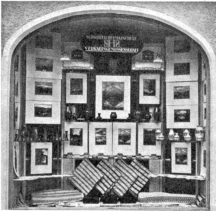
Verkaufsgenossenschaft des SHS: Schaufenster in Arosa.

aus und zieh' dir meine an. So, jetzt wird's dir warm werden. Jetzt sag: weiß denn deine Mutter, daß du von daheim fort bist? Und warum bist du fort? So allein in der bösen Nacht?"