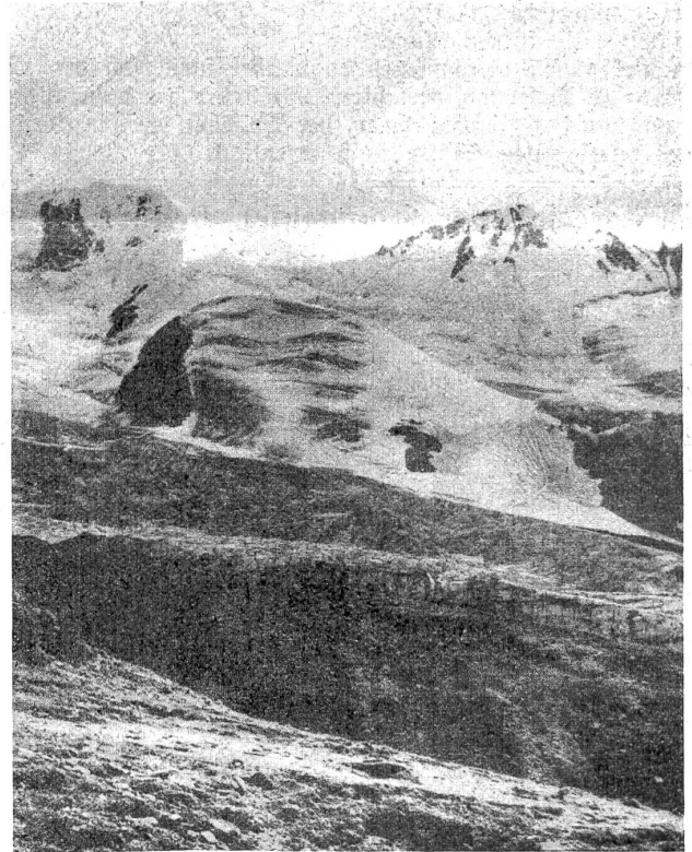
Schrötterhorn und Kreilspitze.

Unsere Bilder zeigen die Verhältnisse, in welcher die Verteidiger der Hochgebirgsfront leben müssen. Das ist die Welt, in welcher österreichisch-ungarische Soldaten ihre Stellungen bauen müssen und in welcher eiserner Wille auch Geschütze, selbst schweren Kalibers, sprechen läßt. Was es bedeutet, eine Kanone oder einen Mörser von der Talsohle bis weit über 3000 Meter hoch hinauf zu schaffen, ist mit Worten kaum zu schildern. Leichter schon ist der Transport von Maschinengewehren und Minen- und Scheinwerfern, obgleich auch er die äußerste Anspannung aller Kraft und die unbedingte Zuversicht für das schließlich Gelingen verlangt. Aber gerade durch diese Aeußerungen eines harten Charakters haben die österreichisch-ungarischen Soldaten aufs neue ihren Wert, selbst in den schwierigsten Lagen, bewiesen.