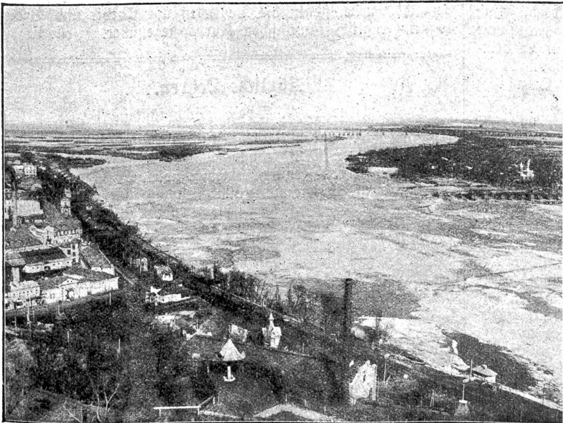
Blick auf die Stadt Kiew und die Ufer des Dnjestr.

Ueber die geheimen Verhandlungen vor der Westoffensive ist unerwartet ein Blicklicht gefallen. Graf Czernin hat in einer Wienerrede behauptet, Clemenceau hätte einige Zeit vor dem Beginn der Schlacht angefragt, unter welchen Bedingungen die Mittelmächte in Friedensunterhandlungen eintreten würden. Als er den Bescheid erhielt, in bezug auf Frankreich gebe es nur ein Friedenshindernis, nämlich seine Ansprüche auf Elßas-Lothringen, wären die Besprechungen zu Ende gewesen. Die Antwort Clemenceaus auf diese Darstellung war kurz: „Czernin hat gelogen.“ In der Diplomaten-sprache sagt ein solcher Satz nichts. Wenn eine Ware hundert Franken kostet und ich behaupte, sie koste neunundneunzig, dann antwortet ein Clemenceau: „Sie haben gelogen.“ In der nun folgenden Polemik erwies sich, daß Clemenceaus „Anfrage“ erst nach verschiedenen österreichischen Anknüpfungsversuchen erfolgte, daß in der Schweiz, und zwar in Freiburg, seit August 1917 mehrfache Besprechungen stattfanden, bei denen Oesterreich durchaus der einladende Teil war. In Paris behauptet man nachträglich, auf die Besprechungen nur deshalb eingegangen zu sein, weil sie gute Informationsquellen über die innere Lage des Feindes eröffneten. Ferner wäre der österreichische Vertrauensmann, Graf Reverteira,