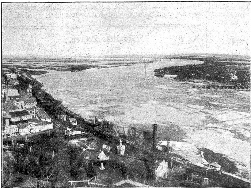
Blick auf die Stadt Kiew und die Ufer des Dnjestr.