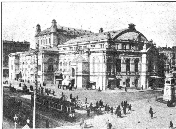
Vor dem Opernhaus in Kiew.

rüstete sich und verfaßte in geheimen Sitzungen Rüstungspläne, die zu Eroberungsplänen werden, sobald sie offensiv gedacht werden — defensiv wären sie sinnlos.