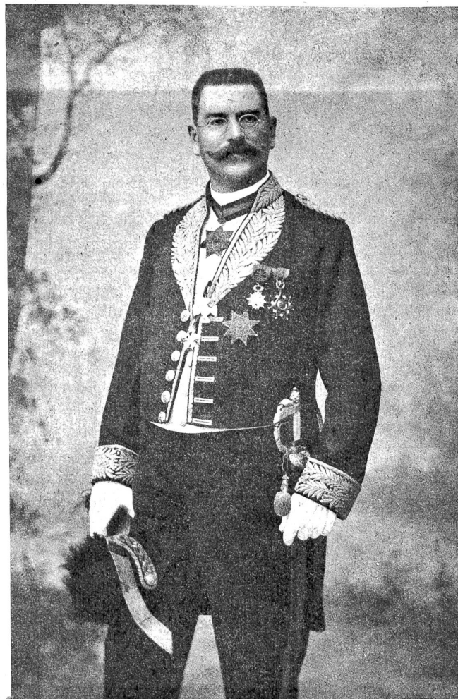
Minister Alfred Ilg.

In dieser Zeit erwachte in dem kühnen Maschineningenieur der Plan, seine Kräfte in den Dienst eines großen Werkes zu stellen, auch wenn es außerhalb seines geliebten Vaterlandes sein mußte. Er machte Bekanntschaft mit Herrn Furrer von der Firma Furrer und Escher in Aden. Dieser suchte für seine Majestät den König Menelik von Schoa