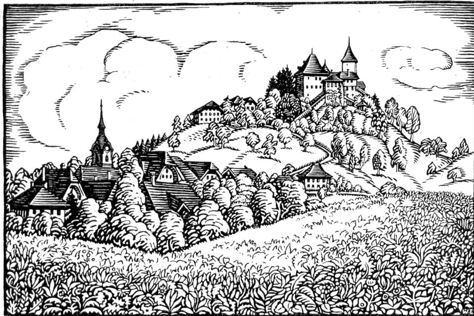
Anstalt und Schloss Trachselwald mit Dorf und Kirche.

sal verhüten können. 15 Jahre später beschloß der bernische Große Rat die Errichtung einer Erziehungsanstalt für sittlich verwahrloste Knaben und Jünglinge im ehemaligen Anstaltsgebäude von Trachselwald; die Anstalt wurde 1892 eröffnet; sie blickt heute auf ihr 25jähriges Bestehen zurück. Bis 1913 stand sie unter der tüchtigen Leitung des Herrn F. Großen, eben des Verfassers der Schrift, die zu diesen Zeilen den Anlaß gab. Das Büchlein ist ansonst geschmackvoll und vornehm ausgestattet, gar nicht wie ein gewöhnlicher Anstaltsbericht. Werner Engels Holzschnitte bilden einen künstlerischen Schmuck, wie man ihn gediegener nicht leicht antrifft; die unserem Aufsatz beigegebenen Illustrationen sind ein Beweis hierfür. Wir möchten das Büchlein allen Freunden der Armen und allen Gotthelf-Freunden insbesondere warm empfehlen, umso mehr, als sein Ertrag dem Hilfsfonds der Zwangserziehungsanstalt Trachselwald zufließen soll. H. B.