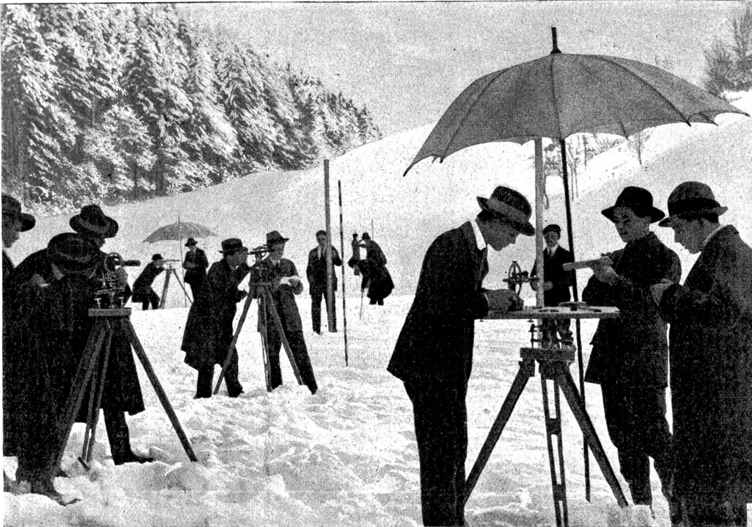
Aufnahmen im Felde durch Schüler der Tiefbau-Abteilung.

sich die verbotenen Eingänge zu industriellen Anlagen. Eine Mehrung des Reisefonds wäre eine willkommenen Stütze dieser Bestrebungen.