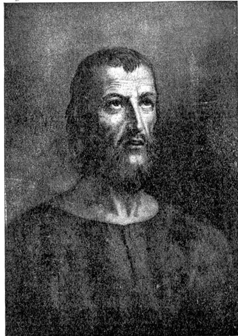
Zur 500. Gedenkfeier an Niklaus von der Flüe (21. März 1417-1917). Niklaus von der Flüe (Bruder_Klaus) geb. in Sachjeln am 21. März 1417.

mit dem Nachmittagszug nicht kam, sagte sie zu Richard, der bei ihr kniete, auf jedes Flüstern von ihr laufend: