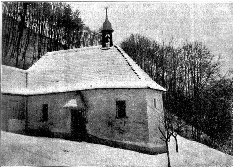
Zur 500. Gedenkfeier an Niklaus von der Flüe (21. März 1417-1917). Die Bruder Klaus Kapelle im Ranft bei Schlüli.