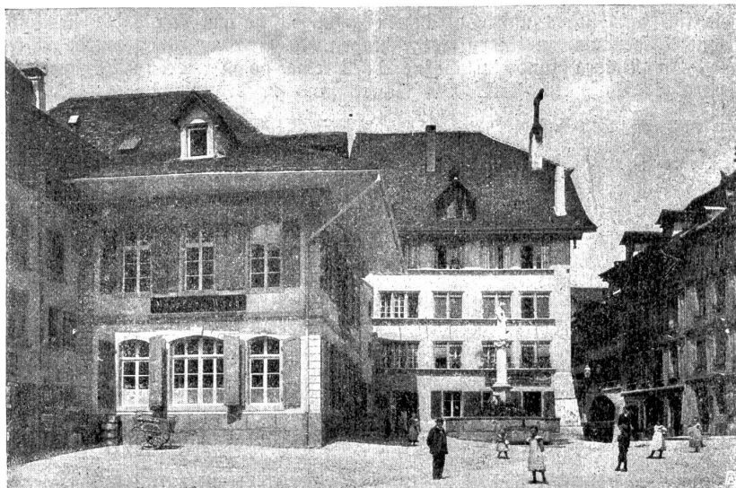
Burgdorf. Grosshaus von Süden und Kaufhaus. Städtliche, wohlproportionierte Bauten mit währschalten Dächern.

Auch in der nähern Umgebung der Stadt fehlt es nicht an charakteristischen Bauten, wie z. B. die innere Wynigenbrücke. Mit der äußeren Brücke bildet sie eine