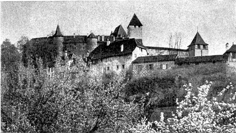
Schloss Burgdorf, Nordfront. Davor die letzten Reste der Ringmauer und der von ihnen umschlossene alte Markt.

posantesten mittelalterlichen Wehrbauten der Schweiz. Das zweite Bild zeigt den innern Schloßhof mit dem die beiden Haupttürme verbindenden neueren Mittelbau. Reizend ist besonders die Ansicht der Nordfront mit dem von den letzten erhaltenen Resten der Ringmauer umschlossenen alten Markt und den alten, in diese hineingebauten Häusern, von denen das große, in der Mitte des Bildes sichtbare, das ehemalige Sähaus des Klosters Trub war und noch aus dem Anfange des 16. Jahrhunderts stammt.