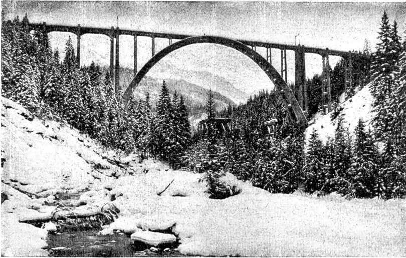
Langwieser Viadukt der Chur-Arosa-Bahn. Eine der schönsten Eisenbahnbrücken der Schweiz. Gesamtlänge 285 Meter.

und dem Gimhana zu. (Schlitteln mit Ueberwindung von Hindernissen.)