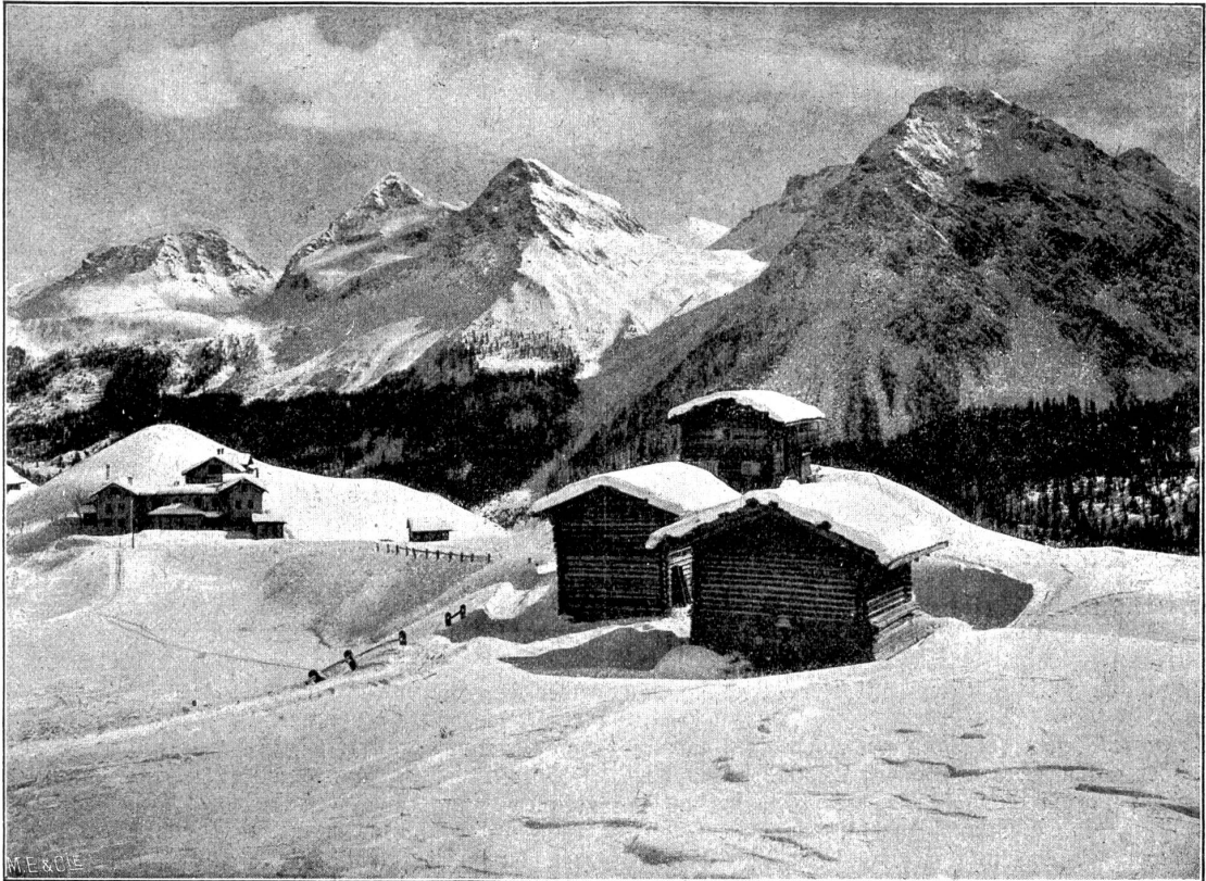
Blick auf die Arosa Berge.

Töchter in den Gasthäusern als Portiers, Köche, Zimmermädchen, Saaltdöchter usw. ein schönes Geld verdienen. Auch bringen sie heute ihre Milch gerne in die Hotels, wo man ihnen einen schönen Preis dafür bezahlt, wie ebenfalls für das Schlachtvieh und nicht zuletzt für das Land. Inner-Arosa wird deswegen den Charakter als Bergdörfchen nicht verlieren; denn die Gemeinde ist bestrebt, sich die alten Hütten und das malerische Kirchlein zu bewahren. Hinter diesem liegen Steinblöcke aufeinandergetüschelt und zwischen grauen Geröthalden eingebettet funkelt der von Alpenrosen-gesträuch umkränzte Schwellsee.