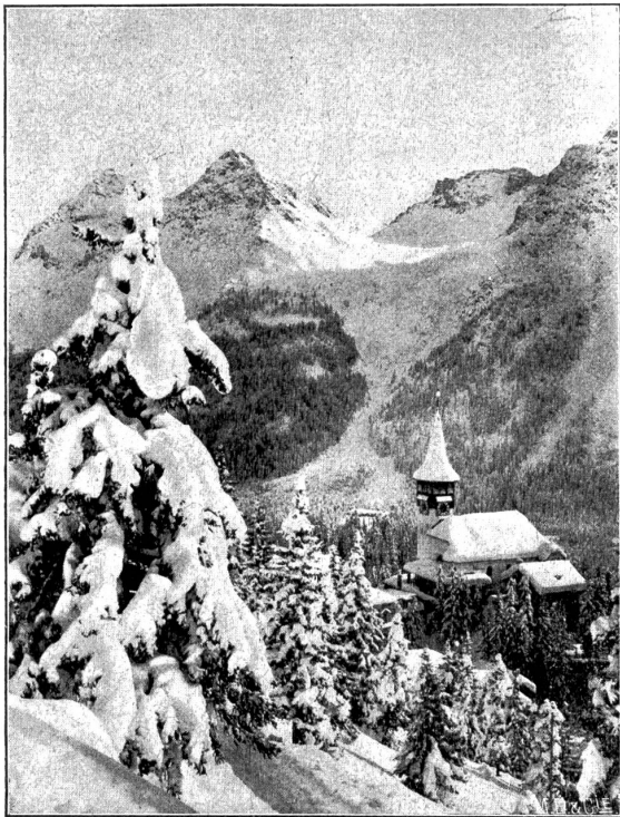
Kirche von Arosa mit Blick auf Furkapass.

Bahn, steigen wir in die Chur-Arosa-Bahn ein, die uns in einer zirka 25 Kilometer langen, genußreichen Fahrt