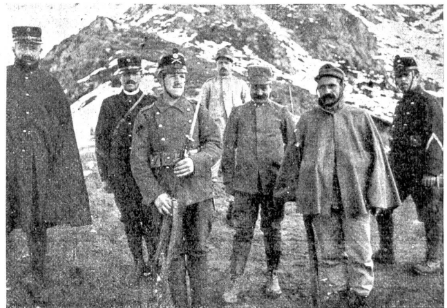
Schweizer- und Italienerposten im Cessiner Grenzgebirge.

Vom Krieg reden sie nicht gerne. Begreiflich; sie haben ja wenig zu rühmen. Einige allerdings konnten sich nicht enthalten, ihrem Unwillen über den Krieg Ausdruck zu verleihen, und ein blutjunger Leutnant erklärte ganz offen, daß er ihn als ein großes desastro (Unglück) für Italien