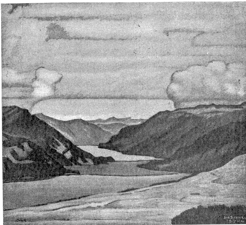
Max Brack. — Blick auf Chuner- und Brienersee.

Von der verfeinerten europäischen Kultur sind die Bewohner unseres abgelegenen Grenzortes noch nicht heimge sucht. Die spartanische Einfachheit aus Großvaters Zeiten hat sich erhalten bis auf den heutigen Tag. Im ruhigen