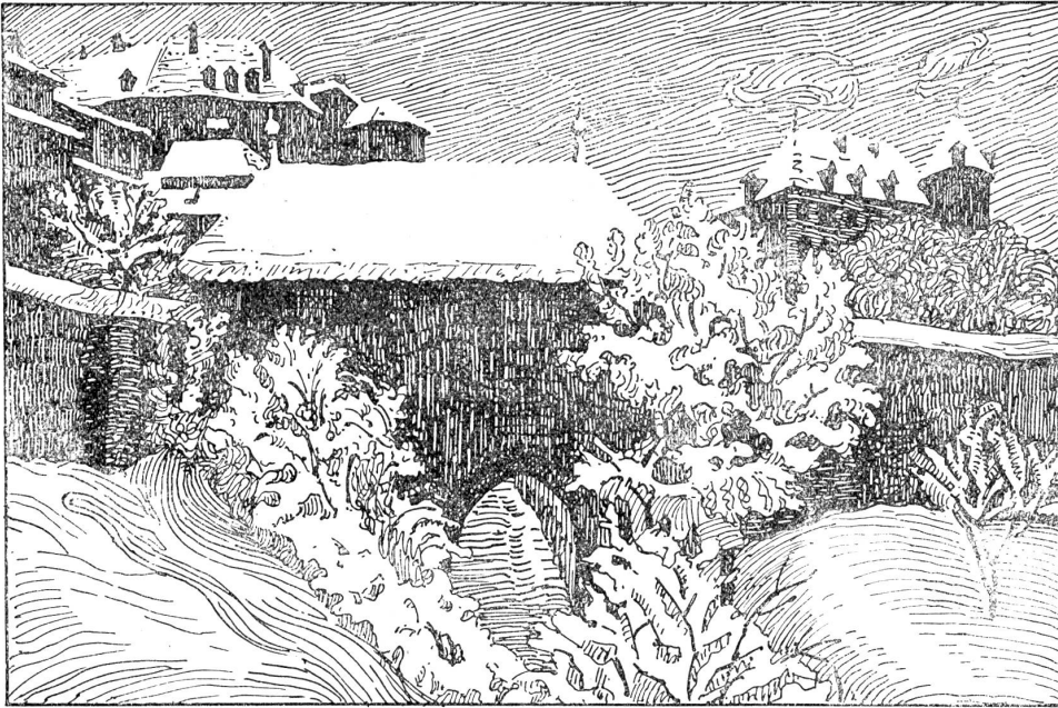
Grezerz. Porte St. Agathe.