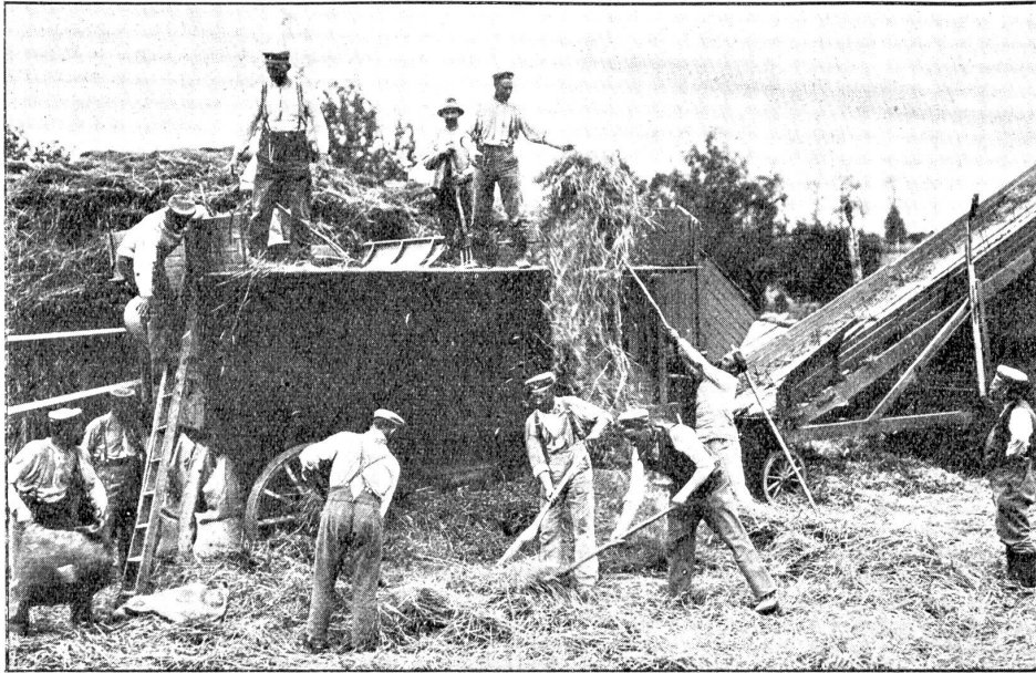
Erntearbeiten in dem von den Deutschen besetzten Gebiet. Das Ausdreschen des Getreides.

Herr alt-Bundesrat Dr. L. C. Robert Comtesse, seit 1911 Direktor des internationalen Bureaus für geistiges Eigentum in Bern, feierte am 14. August in bester Gesundheit seinen 70. Geburtstag.