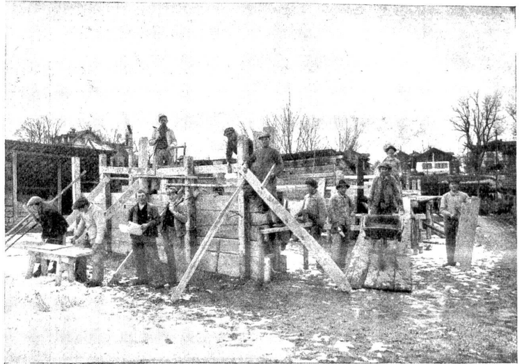
Praktischer Maurerkurs: Winter-Semester 1916/17.

Bei Ausbruch des Krieges, als das Ausland seine Angehörigen unter die Waffen rief, wurde man so recht gewahr, wie sehr die Schweizer sich dem Maurerhandwerk entfremdet haben. Nicht nur der Maurer selber, auch die Werkmeister und die mit dem Bauhandwerk verwandten Branchen rekrutierten sich allmählich dermaßen aus Ausländern, daß man nur selten mehr Schweizer in ihnen traf. Geradezu typisch wurde der Italiener, der als kleiner, schwächerer Maurerhandwerker in die Schweiz kommt, und sich im Mannesalter als Besitzer ganzer, von ihm erstellter Häuserzüge präsentiert. Die Entfremdung vom Maurerhandwerk wurde in den letzten Jahren nachgerade so groß, daß nur noch höchst selten ein Schulentlassener ihm zugeführt wurde. Seit Ausbruch des Krieges hat nun eine kräftige Bewegung eingesetzt, um dem Maurerhandwerk wieder Schweizer zuzuführen. Sowohl Fachreise als Behörden tun ihr Möglichstes, um diese Wandlung zu vollziehen. In Bern war es die Gewerbeschule der Stadt Bern, die die Initiative ergriff, durch Errichtung eines praktischen Kurses dem Maurergewerbe die Unterlage zu schaffen, die der größte Teil unserer