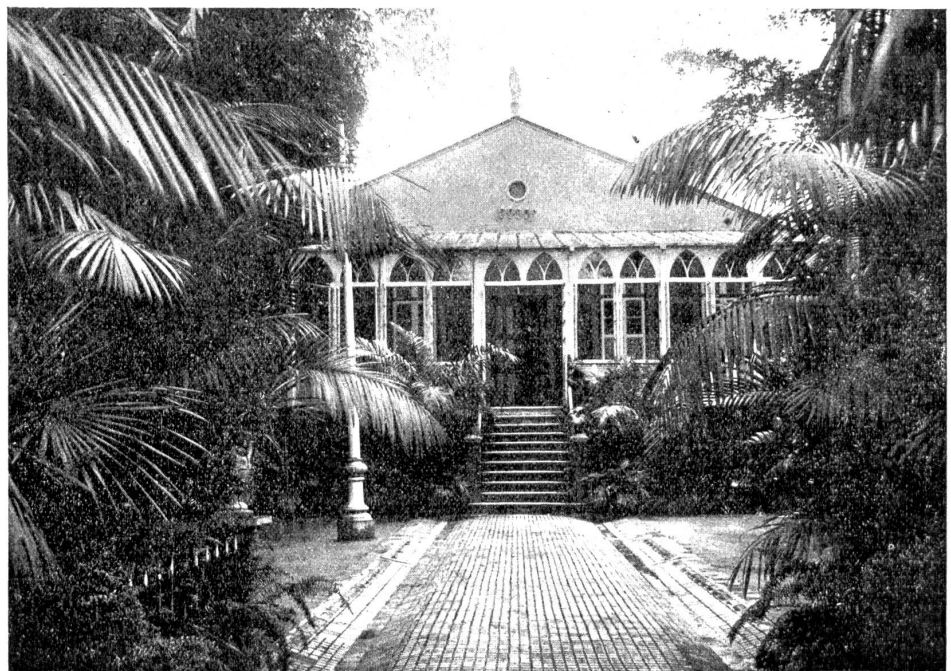
Das Museum Göldi in Pará.

studiert an der dortigen Hochschule. Nach einem Jahr öffnet sich ihm eine Lehrstelle in Jena; so kommt er zu Professor Häckel, wird sein Schüler und bald sein Assistent. Zur Vertiefung seiner Studien geht er nach Leipzig und Berlin