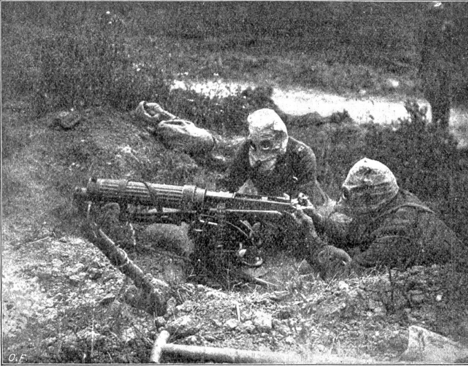
Geschützmannschaft mit der Gasmasken.