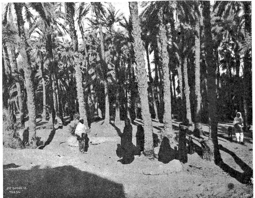
Im grossen Palmenhain bei Derr.

Alles hat nun die nötige Plastik gewonnen; denn wir sind nur noch etwa hundert Meter von der Uferbank vor dem Felsentempel entfernt. Stumm und steif sitzt der Pharao Ramses II. als Steingott in dreifacher Wiederholung als Riesenkoloss zu beiden Seiten des Tempelganges; er ist zum Steingott geworden, während er ja