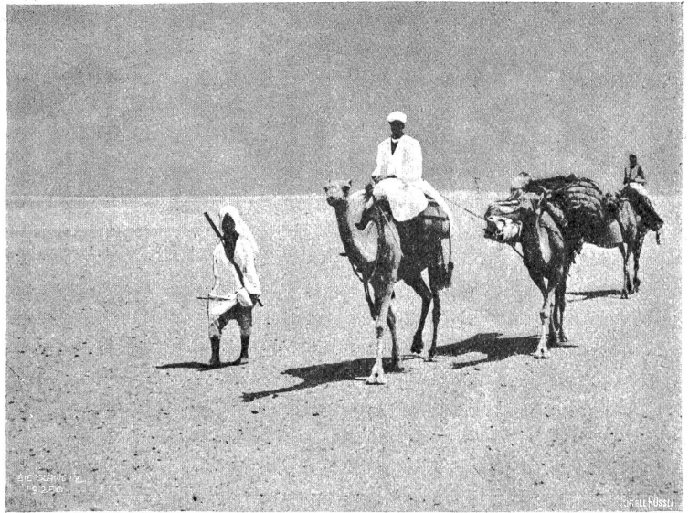
Karawane in der libyschen Wüste.

zu den Kolossen, die uns ganz in ihrer Gewalt hatten, und haben staunend an den Steinriesen emporgeblidht, an diesen