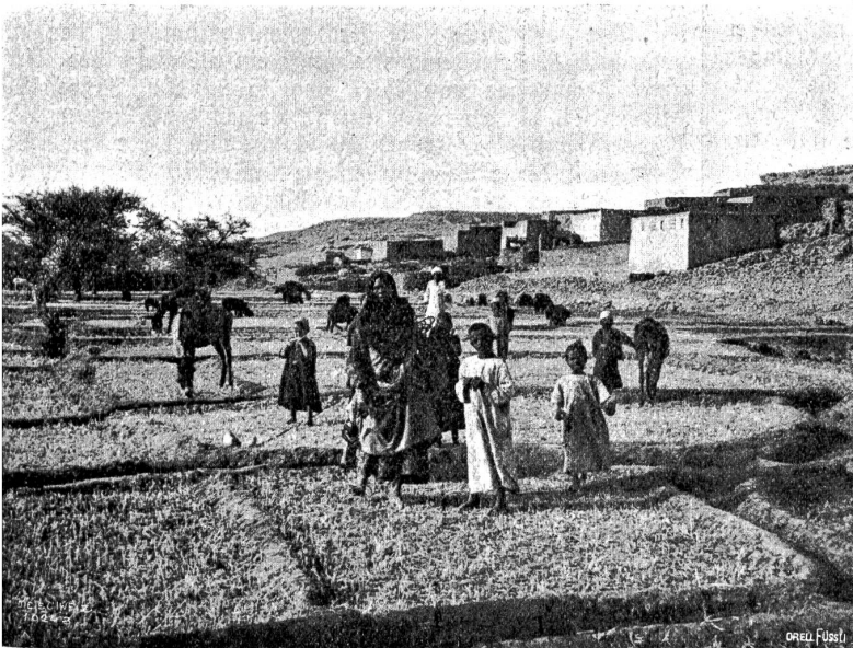
Nubisches Dorf am Rand der libyschen Wüste.

die Riesenarbeit viermal wiederholt hat an derselben Felswand, so ist allein schon der Umstand, daß er so genaue Kenntnis des Gesteins hatte, daß er sich sicher sagen konnte, kein Riß, kein Sprung, kein sprödes Stück werde die Arbeit zerschanden machen, staunenswert. Wie haben die Alten dies nur ausfindig machen können? Eine ganz gründliche Vorprüfung des Gesteins war doch notwendig, bevor die Arbeit in Angriff genommen wurde. Dazu kommt noch, daß der ägyptische Meister ein etwas helleres Felsband geschickt dazu benutzte, um die Häupter daraus herauszumeißeln, was ursprünglich die Wirkung noch bedeutend erhöht haben muß; jetzt allerdings hat der Streifen unter den Verwitterungsprozessen bedeutend nachgedunkelt. Ein Fries von betenden Affen zieht sich über der Tempelfront hin, jedes einzelne Tierbild in feinen Linien eine genaue Wiedergabe der Natur! Die Linien sind der Natur unmittelbar abgelautsch; die alten Künstler haben ihr eben in vielen Beziehungen näher gestanden als wir; was der Fries zeigt, sind Affen, Affen und nichts anderes! Und wenn auch alle Details fehlten und nur die Umrisse so da wären wie sie sind, so müßte sie jedes