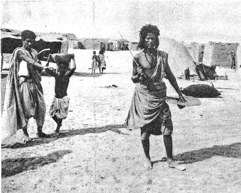
Ein Scheich der Bischarin aus dem Lager bei Assuan.

wenn sie absolut unvermeidlich ist. Frohmütig bleibt er aber unter allen Umständen, und ärgerliche Gesichter habe ich eigentlich auf der ganzen Fahrt nie gesehen, obgleich die Burschen bisweilen hart arbeiten mußten. Das ist typisch für die Barabra. Ob der Barabri am mächtigen Steuerruder stundenlang sitzen muß, ob er am Ruder zieht oder das Boot am Seile schleppt, ob er im Sonnenbrande harte Feldarbeit tut oder das Schädelf heben muß, ob er in der Fremde von seinem weißen Herrn als Diener ausgehuldet wird oder als Koch von der Madame sich alle Gemeinheiten ins Gesicht sagen lassen muß, er bleibt trotz allem frohmütig; Allah hat an ihm noch einen ergebeneren Sohn als am etwas mürrischen ägyptischen Fellachen oder selbst an dem Sohn der Wüste; er trägt mit der angeborenen Arbeitsfreude, die aber nie ins Extreme fällt, alles mit Gleichmut, was das Leben bringt. Nur seinen nubischen Nationalstolz darf man nicht verletzen, und mag man ihn selber noch so sehr aushulden, gegen die Heimat darf nie ein verächtliches Wort fallen, sonst hat man einen hitzigen Feind an ihm!