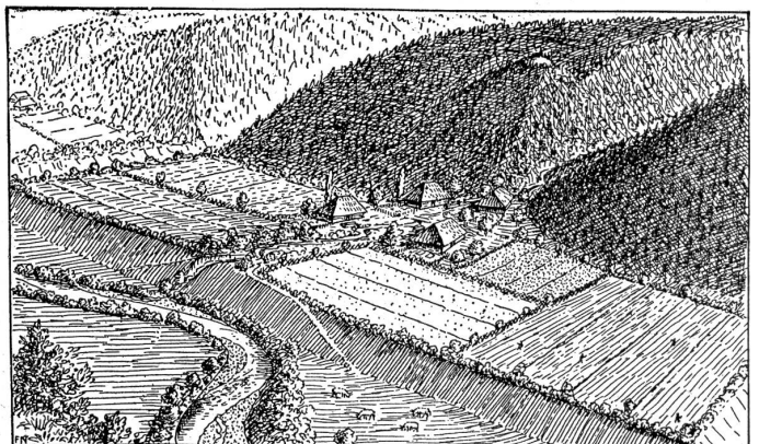
Alemannische Ansiedlung. Originalzeichnung von Dr. S. Ruffbaum. (Erzählungen aus der heimatliden Geschichte.)

Die Schule hat hier eine wichtige Pflicht und Aufgabe zu erfüllen. Man hat ihr in Erkenntnis dieser Tatsache ein eigenes neues Fach gegeben: die Heimatkunde. Unter Heimatkunde im weitem Sinne versteht die Pädagogik nicht nur die Erforschung der geographischen Erscheinungen der engern Heimat, sondern sie bezieht in den Bereich dieses Faches überhaupt alle Dinge der Umwelt, deren Erkenntnis das Fundament der Geistesbildung darstellen soll. Die