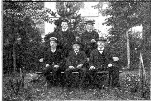
Pensionäre der Anstalt.

wieder geweckt, der Heilung von innen heraus die Wege gebahnt. Dabei wird jede Aufdringlichkeit vermieden; man schlägt sich nicht mit Lehrsäzen und Moralpredigten herum, man lebt vielmehr praktisches Christentum. Jede rechte Trinkerheilstätte bildet ein Bollwerk im Kampfe gegen den Alkoholismus. Noch viel zu wenig werden die Bemühungen der „Nüchtern“ um die Trinkerwelt gewürdigt. Das Geld, das für eine Kur ausgelegt wird, trägt reichliche Zinsen. Auch den Unbemittelten ist es möglich gemacht, die Anstalt