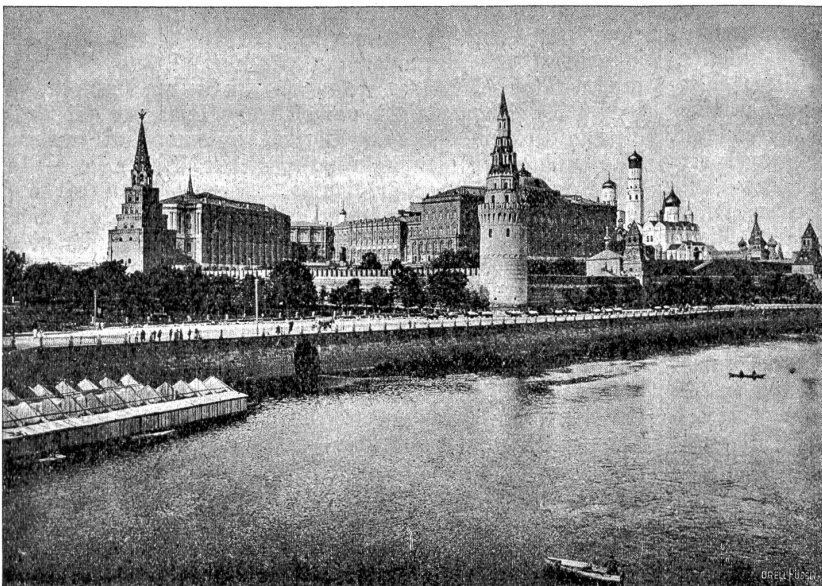
Der Kreml, die „Cité“ Moskaus, eine Stadt für sich. Kreml, tatarisch soviel als „Burg“, 5-torig, mit 21 Türmen auf der Ringmauer. Ueber Moskau geht nur der Kreml, über den Kreml nur der Himmel.