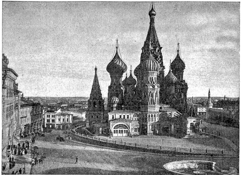
Die Wassilij Blashenny-Kathedrale. Eine der halbbyzantinischen Kuppelkirchen mit der spezifisch russischen Abart der Zwiebelform.