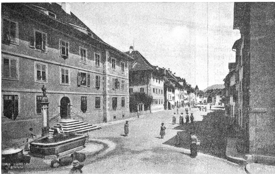
Strassenbild aus Delsberg.