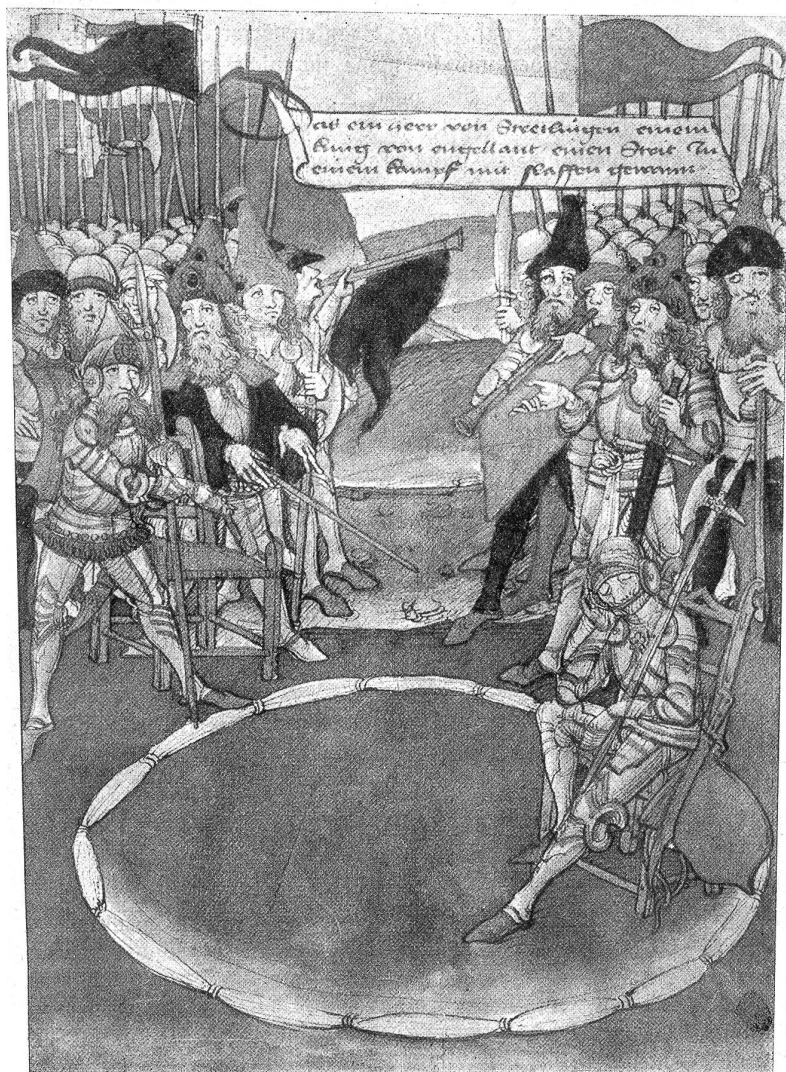
Der schlafende Ritter von Strättligen. Aus dem Spiezer-Schilling. Der Ritter hätte einen schweren Zweikampf bestehen sollen, versiel aber dabei in einen merkwürdigen Schlafzustand, so daß selbst dem unerschrockenen Gegner darüber graute und sich deswegen ohne Kampf für besiegt erklärte.

beim obern Tor), aus dem dann das große und später das Burgerspital hervorging. 1255 kamen die Franziskaner oder Barfüßer nach Bern und bauten sich Kloster und Kirche ungefähr beim Kasino. Wo heut manch Becher von froher Studentenschar gelupft wird (in der Wirtschaft zum Klösterli beim Bärengraben), da hatte bis gegen Ende des 13. Jahrhunderts eine Schwesternkongregation der Barfüßer, die Schwestern an der Brügg, ihr Heim. Dieses war armelig genug, gewährte aber doch den ärmsten Bettlern Aufnahme. Später wurde auf diesem Platz das niedere Spital gebaut, das bei der Bürgerschaft in großer Gunst stand, was sich aus der großen Zahl von Vergabungen ersehen läßt. Hart an der alten Stadtmauer hatten sich im 13. Jahrhundert auf eine Einladung der Stadt hin die Dominikaner angesiedelt. Es ist das Gebiet, auf dem die französische Kirche und die Feuerwehrawache stehen, ganz respectable Anlagen. Bei den Dominikanern abzustiegen, verächteten selbst Kaiser und Päpste nicht. Es galt als Ehre, unter dem Schutz der Dominikaner zu stehen. Ganz angesehene Schwesternkongregationen beschäftigten sich mit der Fürsorge für Arme, so vor allem die Inselfchwester. Woher wohl dieser Name? Zwischen Eisenbahn- und Kornhausbrücke war früher ein kleines Inselfchen, auf dem sich fromme Schwestern unter dem Schutze der Prediger angesiedelt hatten. Dieses Klösterchen