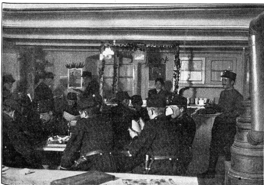
Soldatenstube in Bonfol. (Abends 8 Uhr.)

Die Zahlen beweisen, wie stark die Soldatenstuben besucht werden, dabei ist zu beachten, daß wohl 50 Prozent aller