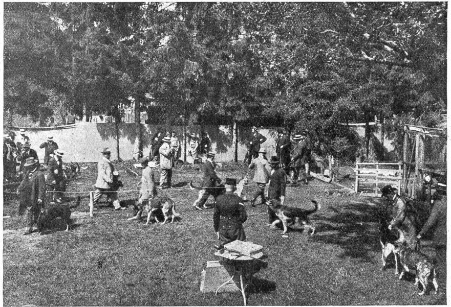
Von der schweizerischen Hundeausstellung in Wabern bei Bern. (Text S. 371.)

Der Bundesrat hat die Verordnung vom 30. Dezember 1899 und vom 4. Februar 1908 betreffend Maßnahmen gegen die Cholera und Pest in ihrem ganzen Umfange mit den Aenderungen in Vollziehung gesetzt, daß vorläufig nur in den Krankenübergabestationen erster Klasse (Basel, Bellinzona, Bern, Biel, Brig, Buchs usw.) und auf sämtlichen Eisenbahnstationen von Korischach