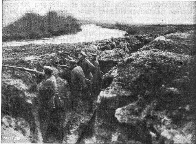
Schützengraben in Frankreich.

Die einsichtige deutsche Presse sieht sich veranlaßt, dieser Auffassung von der demoralisierten russischen Armee entgegenzutreten. Sie hebt gegenteils die Geschicklichkeit der Russen hervor, sich vom Feinde loszulösen, ohne allzu große Verluste zu erleiden. Namentlich seien sie durch die früheren Erfahrungen gewichtig und schonten ihr Kriegsmaterial. So haben sie in der Tat wie Przemyśl nun auch Lemberg geräumt, nachdem sie den größten Teil der Geschütze vorher in Sicherheit gebracht hatten. Die Zahl der Gefangenen übersteigt nicht das relative Maß dessen, was man sich bei einem strategischen Rückzug von diesem Umfange gewohnt ist. Wenn sie auch einige Hunderttausende betragen mag, so steht dieser Schwächung doch auch wieder eine Stärkung gegenüber, gegeben durch den Umstand, daß man den Feind von dessen Etappen abgezogen hat und nun selbst