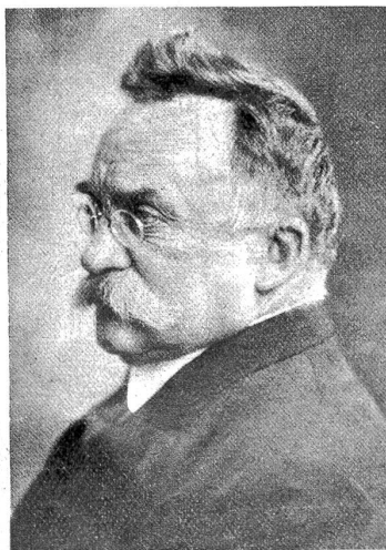
† Nationalrat Dr. Albert Gobat.

Seine ganze Jugend verbrachte er im Jura, und am bernischen Jura hing er bis zu seinem Tode mit hingebender Liebe. Oft und gern betonte er die anders geartete Natur des bernischen Jurassiers, und wenn er, wie noch vor zwei Jahren, an der Generalversammlung des bernischen Handels- und Industrievereins in Delsberg, über seine engste Heimat reden durfte, dann glühte er auf in Begeisterung, und mit einem gerechten Stolz wies er auf die gewaltigen Leistungen des Jura für sein Verkehrswesen hin. Einen Teil seiner akademischen Bildung genoß Gobat in Süddeutschland, und hier erlernte er die deutsche Sprache, die er im bernischen Großen Rat so oft und gern anwandte. Sobald es sich um eine größere Frage handelte und er die ihm nicht getreuen deutschsprechenden Großräte zu seiner ei-