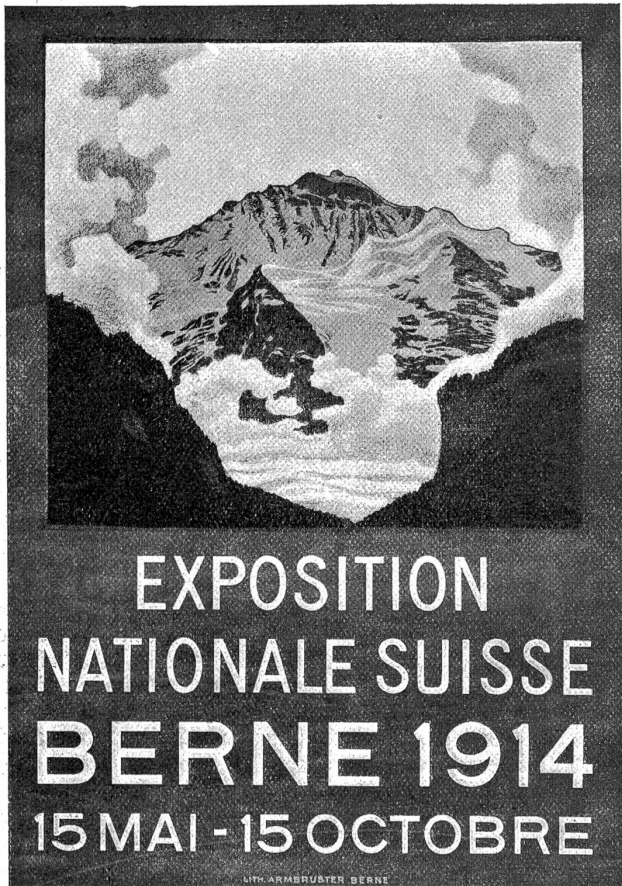
Das neue offizielle Plakat der Schweiz. Landesausstellung 1914 von Plinio Colombi, das nach Frankreich verschickt wurde an Stelle des zurückgewiesenen ersten Plakates von Emil Cardinaux.

„Muecht halt go sueche“, rät trocken der Bauer und zuckt die Achseln. „I cha nüt derfür.“ Dann behändigt er das Leitseil und fährt kaltblütig davon.